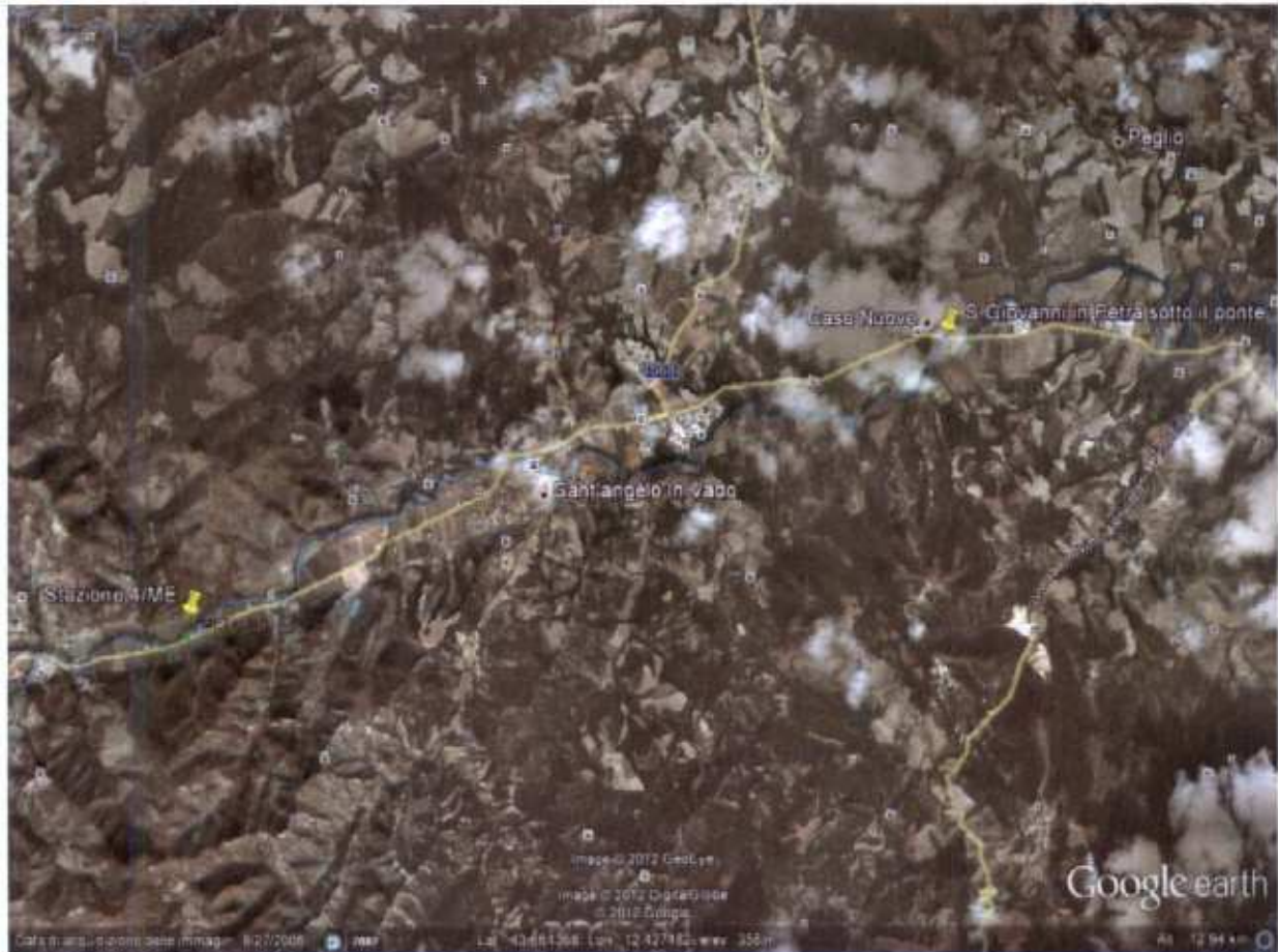
Stazioni monitorate tratto S. Angelo in Vado a monte – S. Giovanni In Petra