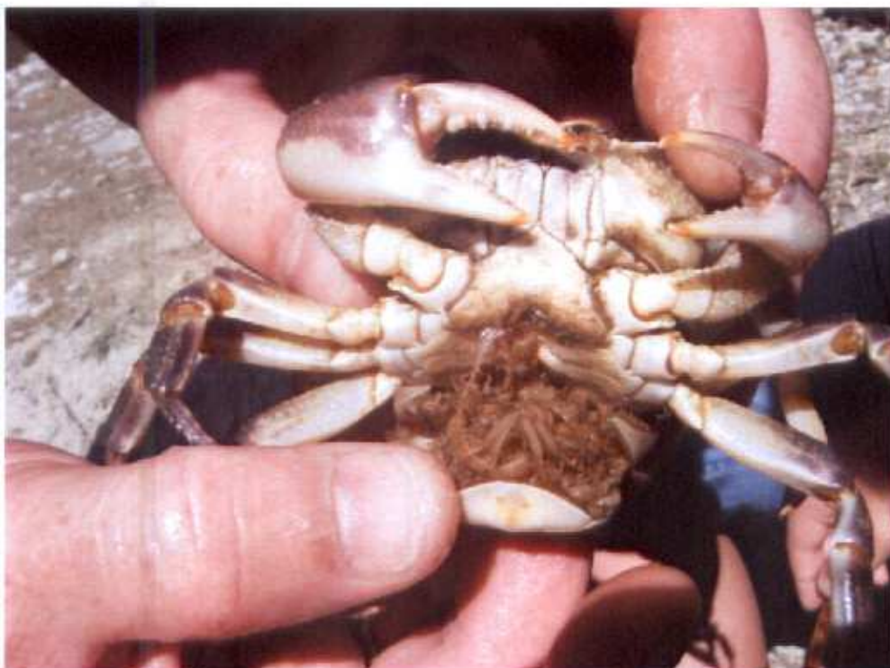
Potamon fluviatile – Granchio di fiume con i piccoli trattenuti nella tasca dell'addome.